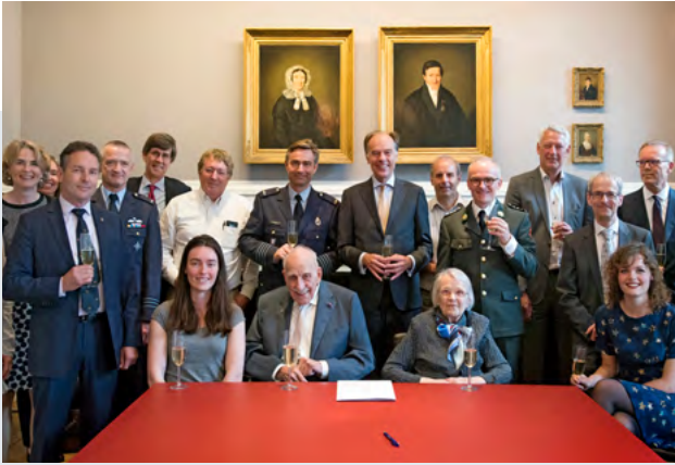
HET ECHTPAAR NYPELS (MIDDEN) BIJ DE TEKENCEREMONIE