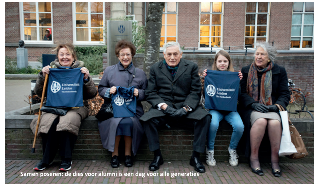
Samen poseren: de dies voor alumni is een dag voor alle generaties