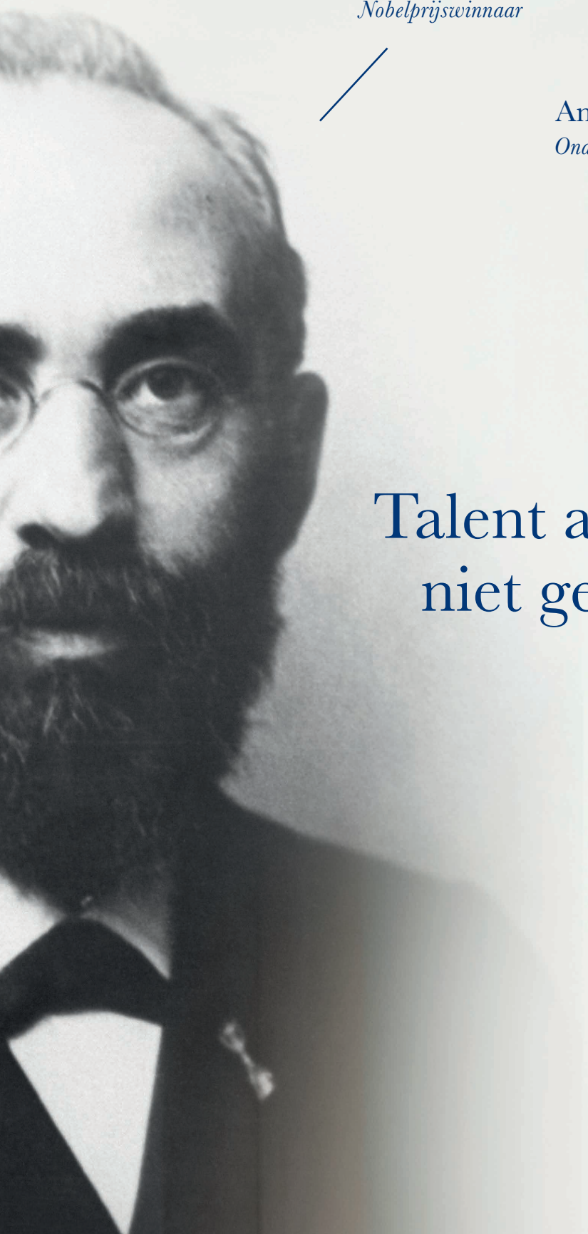
Hendrik Lorentz Nobelprijswinnaar