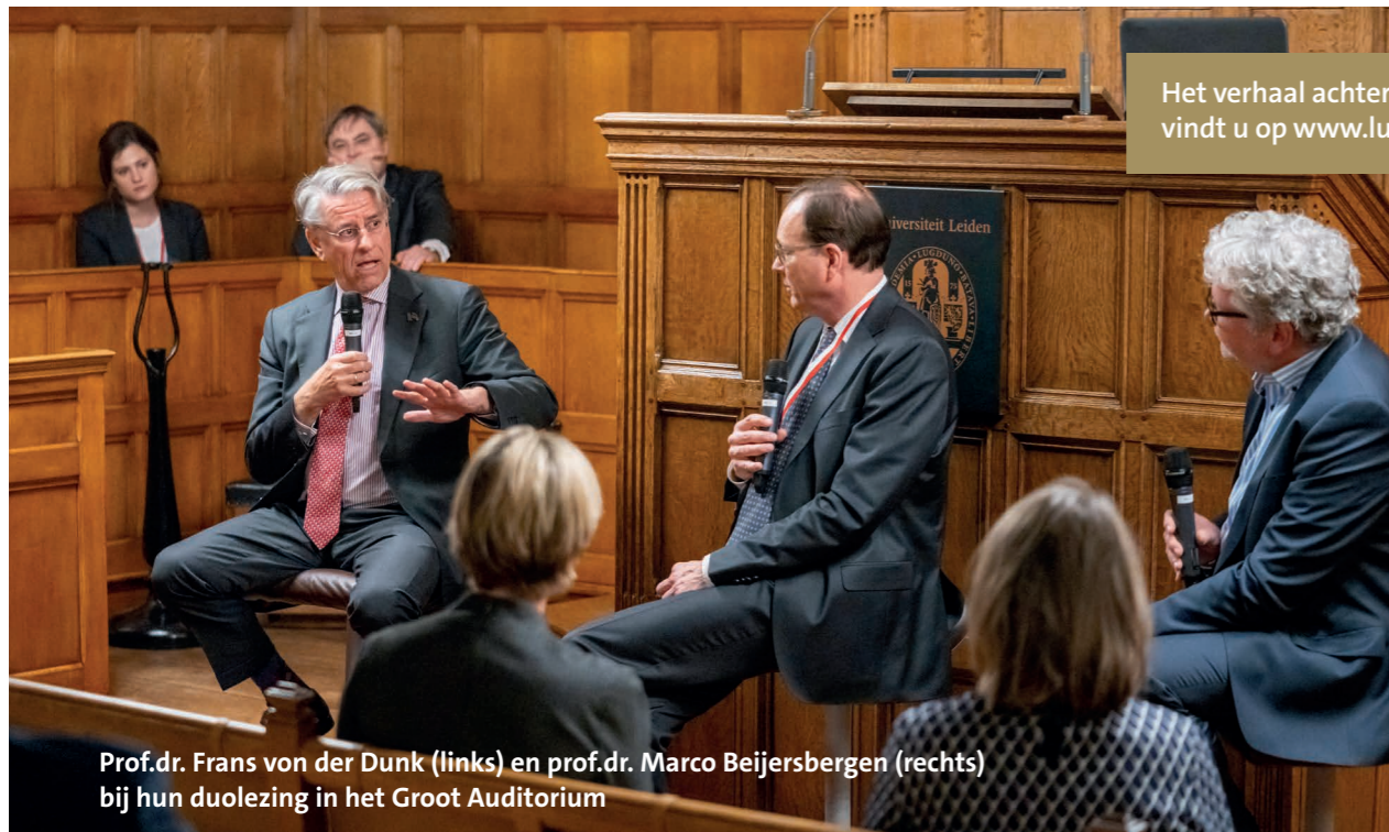
Het verhaal achter de protestrede vindt u op www.luf.nl/historie .