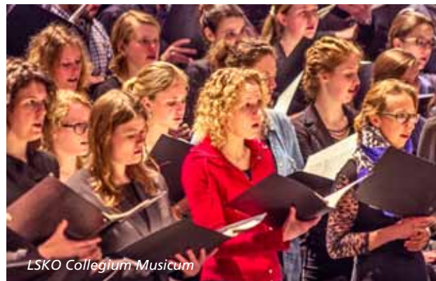
LSKO Collegium Musicum