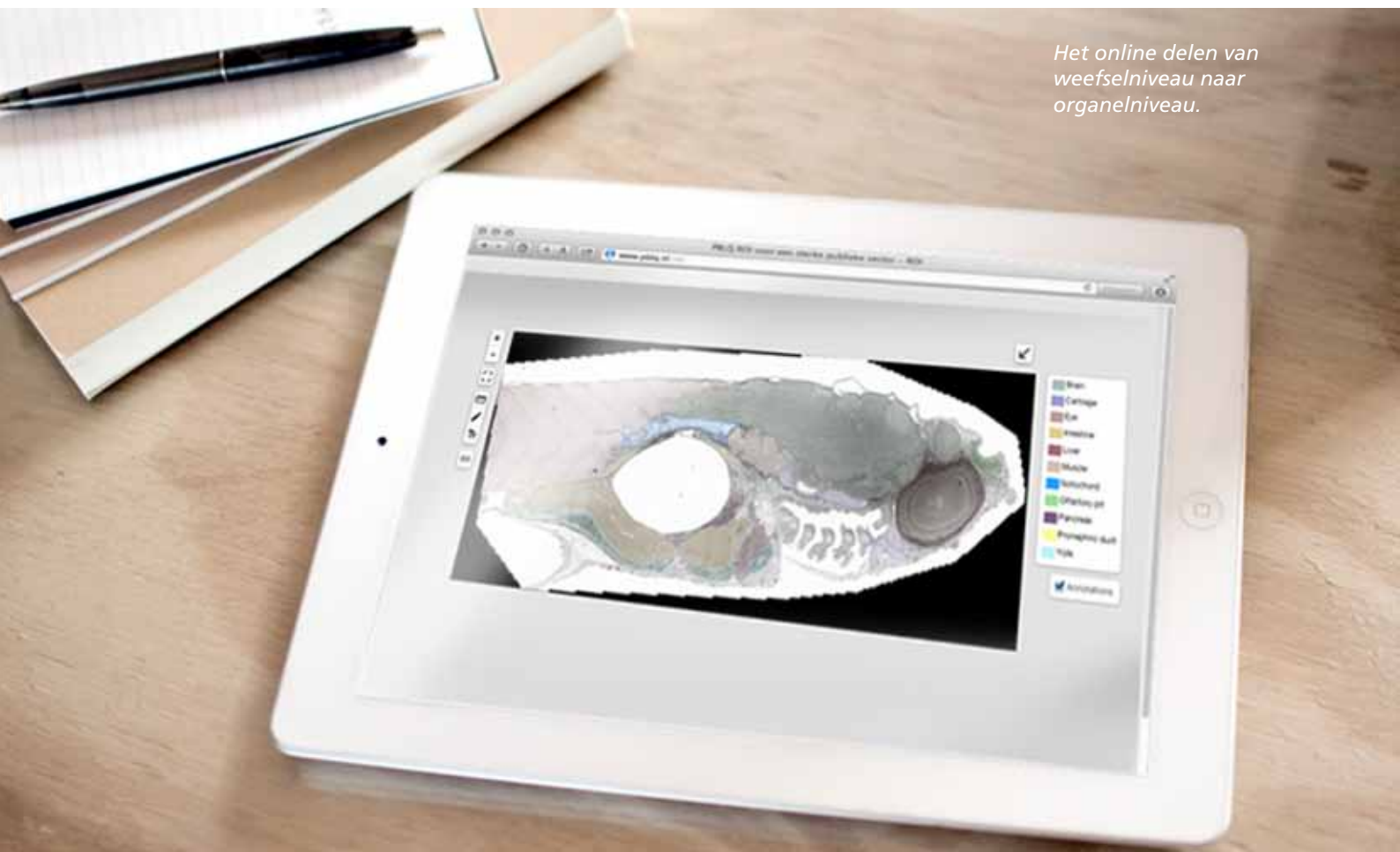
Het online delen van weefselniveau naar organelniveau.

Studenten krijgen aan het LUMC al enige jaren virtueel histologie-onderwijs (lichtmicroscopie). Het LUF en de Gratama Stichting financierden de uitbreiding van de gebruikte viewer. Deze ontwikkeling maakt het mogelijk om van weefsel-niveau naar organelniveau in te zoomen (electronenmicroscopie) en resultaten openbaar online te delen. Studenten testten de nieuwe faciliteiten met spectaculaire beelden van een zebravis. In juni 2016 werd de viewer gepresenteerd op de jaarlijkse conferentie van de International Association of Medical Science Educators (IAMSE).