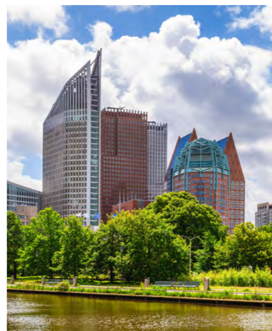
pagina 27 De stad van de toekomst