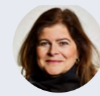
Mw. mr. X.I. Niehe