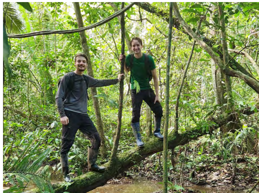
pagina 10 Subsidies voor studenten