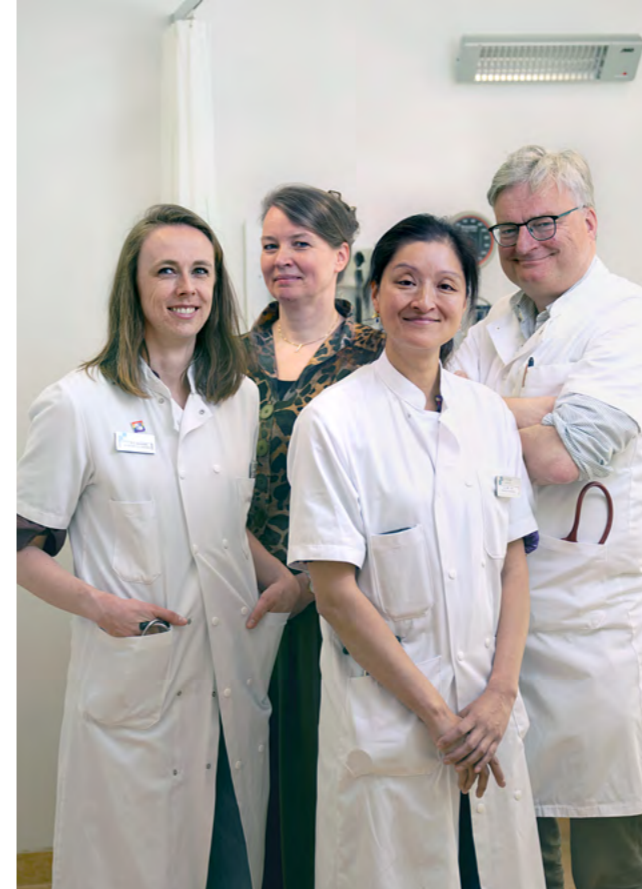
pagina 6 Steun voor onderzoek