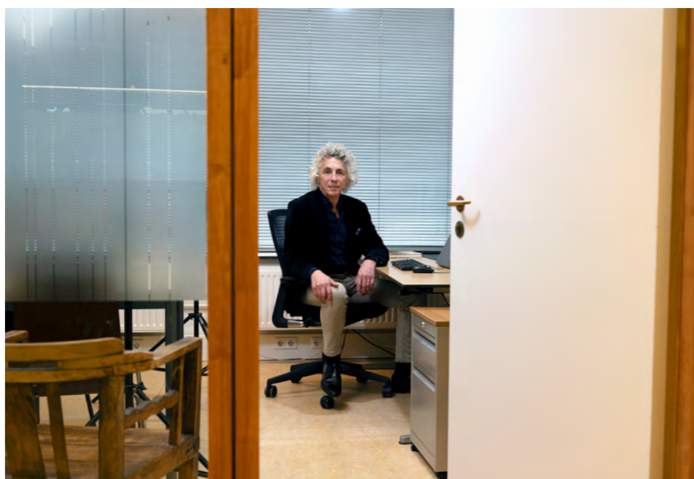
pagina 22 Een bijzondere samenwerking